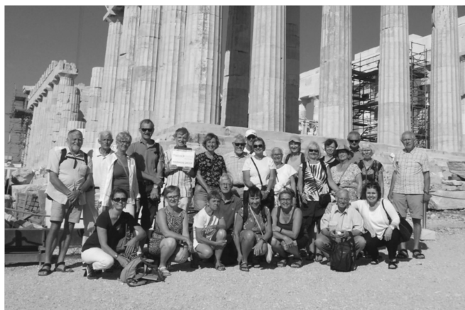
Deltagerne foran Akropolis

Akropolis i Athen er en flad klippe, som rejser sig 150 meter over havet i byen Athen. Akropolis var et effektivt forsvarssystem for de gamle grækere, og det var et næsten uindtageligt fort og et religiøst samlingspunkt, hvor de gamle grækere udlevede deres avancerede arkitektur og hengivenhed for deres religiøse overbevisning.