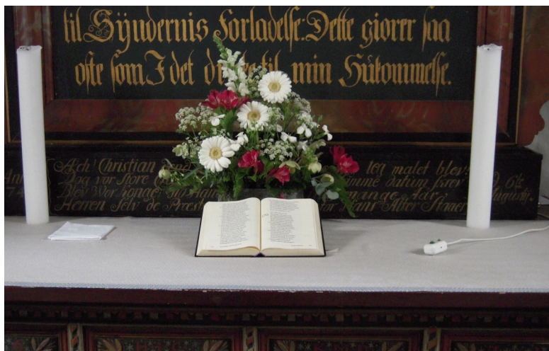
Alteret i Alling Kirke

Det første ordinære møde i det nye menighedsråd er planlagt til Torsdag den 5. januar 2017.